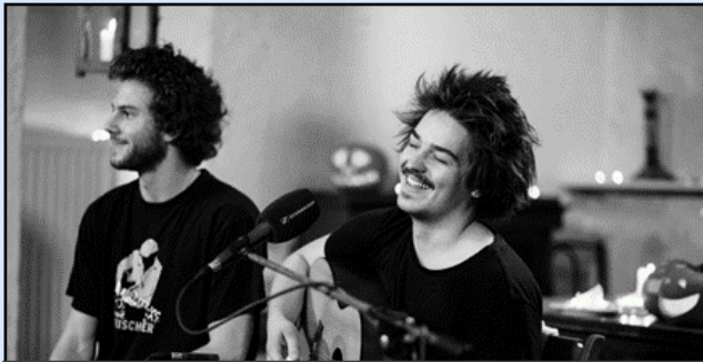
Milky Chance performing in a recording studio