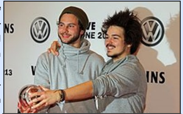
Milky Chance receiving Best Single at the 1Live Krone radio awards

Milky Chance is really creating amazing music that manages to calm people down within just a few moments of listening. Their style is currently unrivalled in the music scene thus allowing Milky Chance to reach new heights. This is definitely not the last time you will hear the name Milky Chance.